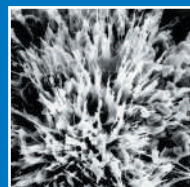
Cristalización Xypex (Madura)

La tecnología por cristalización de Xypex impermeabiliza y protege al concreto contra severos ataques químicos en instalaciones de agua potable y residual. Para estructuras nuevas y rehabilitaciones, la tecnología por cristalización de Xypex es una solución efectiva y permanente que extiende significativamente la vida de servicio del concreto. En EEUU, de todas las especificaciones de cristalización para el segmento de agua potable y residual, el 88% mencionan Xypex, indicando que verdaderamente Xypex sigue siendo.... Sin Igual