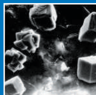
Imágenes Concreto (sin tratar)