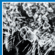
Cristalización Xypex (Inicio)